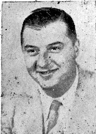
Director Internacional de Educación International Director of EDUCATION