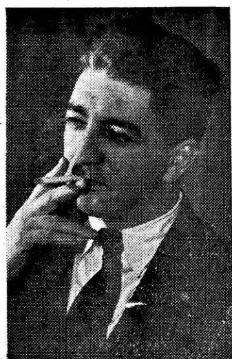
Director Internacional de Organización International Director of Organization

INTRODUCING THE MEMBERS OF THE INTERNATIONAL EXECUTIVE BOARD OF THE UNITED PUBLIC WORKERS-CIO — WITH WHOM WE HAVE BECOME AFFILIATED