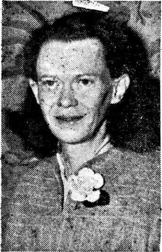
Secretaria-Tesorera Inter- nacional International Secretary- Treasurer