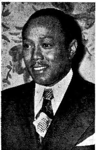
Miembro del Consejo Ejecutivo Executive Board Member

INTRODUCIENDO LA DIRECTIVA INTERNACIONAL DE LA UNION DE TRABAJADORES PUBLICOS UNIDOS-CIO — AL CUAL HEMOS SIDO AFILIADOS